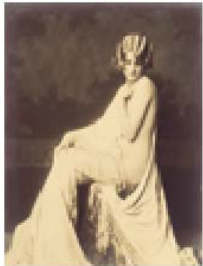
N° 4.- CHENEY JOHNSTON, A.