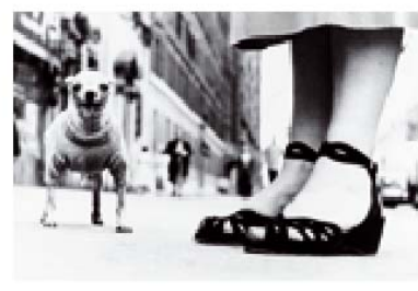
N° 6.- ERWITT, E.