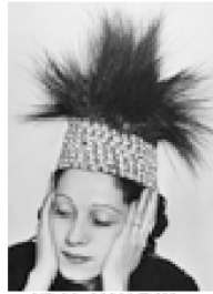
Nº 14.-MAN RAY.