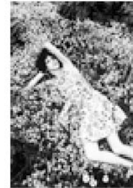
N° 9.- GUNDLACH, F.C.