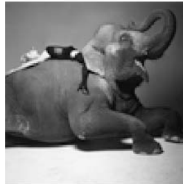
N° 5.- COMTE, M.