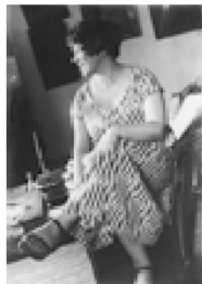
Nº 19.-RODCHENKO, A.