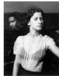
N° 3.- BOUBAT, E.