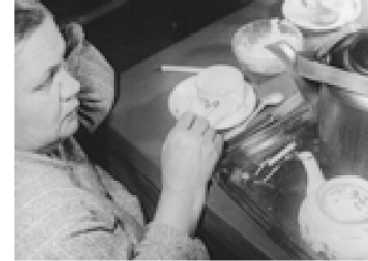
Nº 18.-RODCHENKO, A.